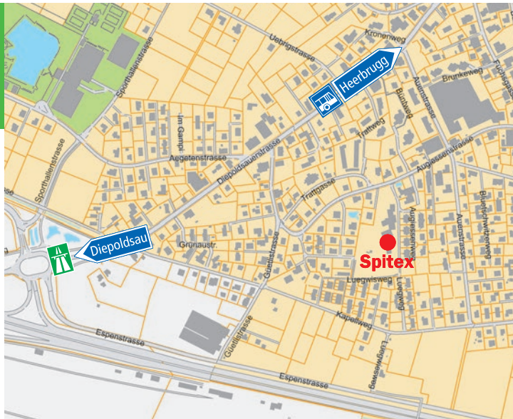
Zentrum Augiessen – Spitex Für die Pflege und Betreuung zu Hause.

Zentrum Augiessen ambulante Haushilfe und Betreuung – Spitex reinigen – betreuen – unterstützen