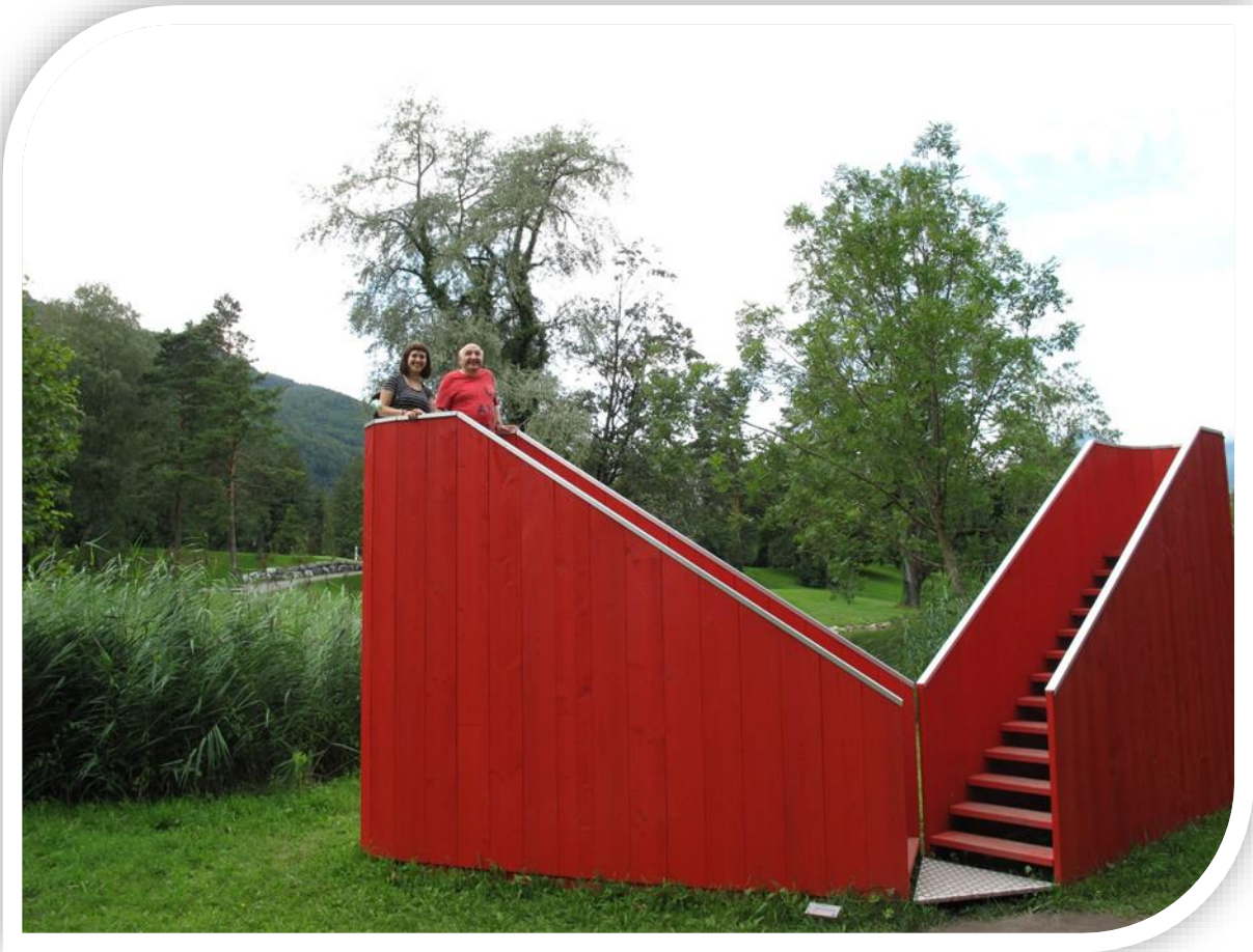
Ausflug zur Ausstellung Bad Ragartz am 9.8.2021

Danke für Ihr Interesse am neuen «dies-und-das»!