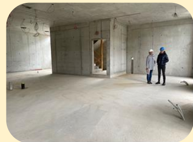
Yvonne Naef und Isolde Horak stehen in den künftigen Spitex Räumlichkeiten.

1. Etage, auf welcher die Grundrisse der zukünftigen Wohneinheit mit Aufenthalt, Essbereich, Stationszimmer, Pflegebad und Appartements bereits gut sichtbar sind. Die unterschiedliche Sicht aus den Fenstern der Appartements liess erkennen, wie vielfältig diese sein wird. Bei den einen wird es die Sicht auf den wohl lebhaft besuchten und durchquerten Platz vor dem Alters- und Pflegezentrum sein, bei den anderen die Sicht auf den wunderschönen, grossen öffentlichen Garten. Ein abschliessender Einblick in die Tiefgarage mit 83 Parkplätzen zeigte den Besucherinnen und Besuchern die ganze Grösse des Neubaus, was alle sehr zu beeindrucken vermochte.