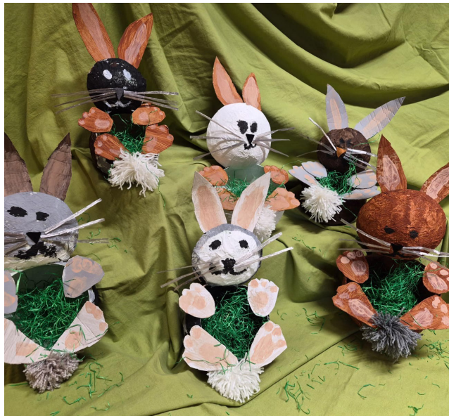
Osterdeko aus dem Kindergarten Girlen