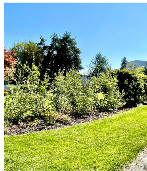
Die politische Gemeinde entfernte beim Friedhof die Kirschloorbeerhecke und hat eine naturnahe Hecke mit artenreichem Krautsaum angelegt (vorher/nachher).