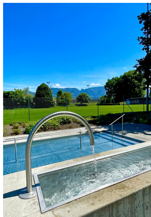
Kneippgarten beim Kapellweg